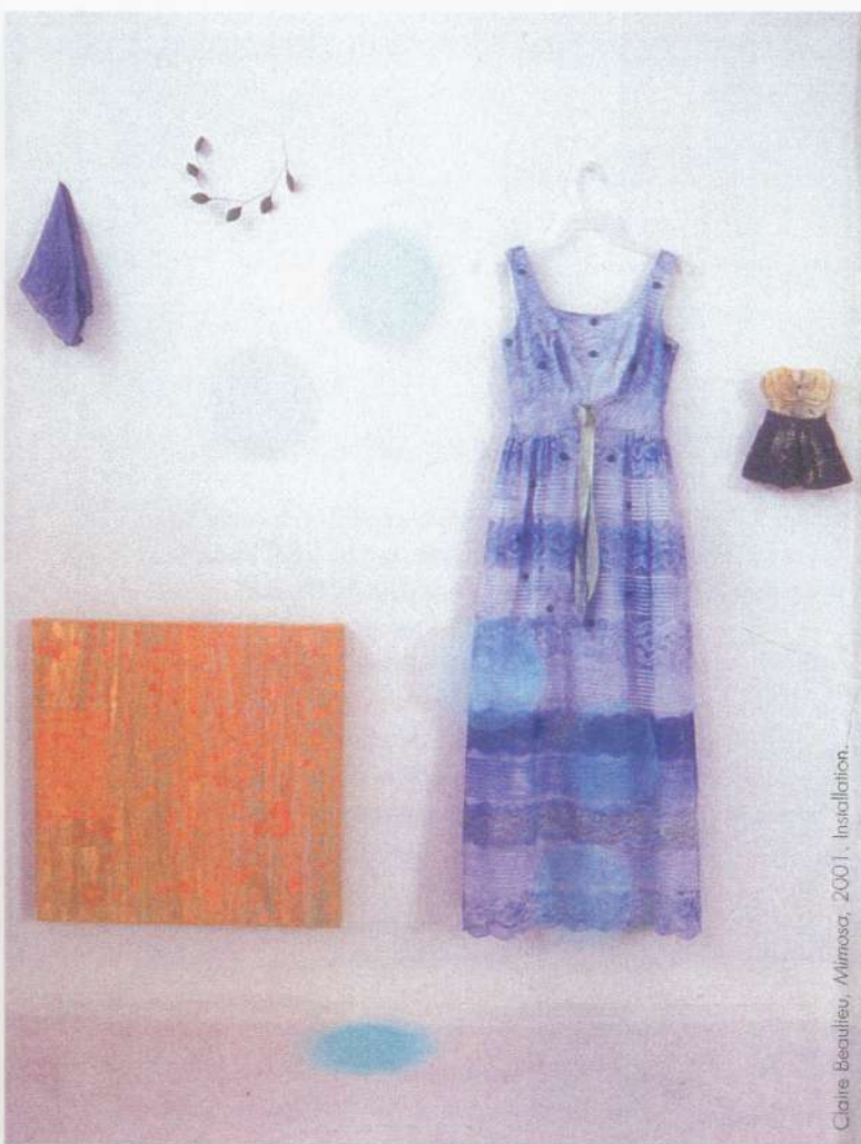
Claire Beaulieu, Mimosa , 2001. Installation.