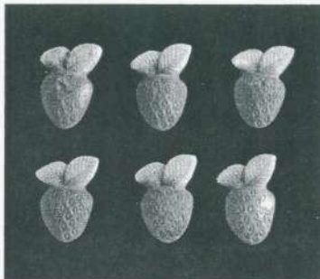
Sylvie Laliberté, 6 fraises, 2001. Galerie Christiane Chassay, Montréal.

et en faire une petite forme gonflée qui emprisonne le souffle dans sa matière marquée par l'empreinte des dents, exposer l'activité ludique d'aligner des friandises sans les manger, juste pour les savourer plus longtemps en les dévorant des yeux, se plaire à entendre le froissement